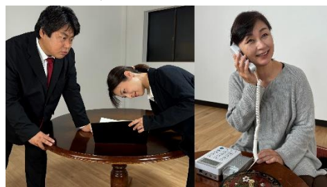
【実施状況のイメージ写真】

(ご希望に応じて、寸劇に併せて警察官による特殊詐欺被害防止講話も実施できます。その場合の実施時間は60分～90分程度となります。)